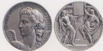
Medalla para premio de la Escuela de Bellas Artes de San Carlos, E. Giner, 1934