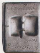
Homenaje a S. Juan de la Cruz, E. Chillida, 1990