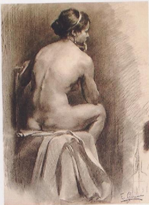
Mujer sentada , E. Giner, 1918