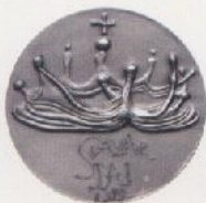
Alegoría al VI Mandamiento, S. Dalí, 1975