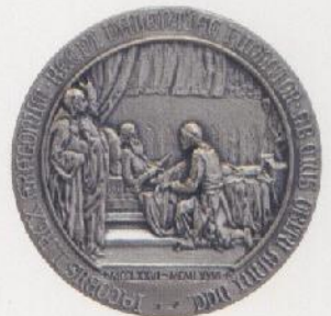
VII Centenario de la muerte de Jaime I, E. Giner, 1976