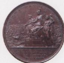
Colonización de Sierra Morena, T. Prieto, 1774