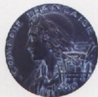
Gira de la Comedie Française R. Delamarre, 1952