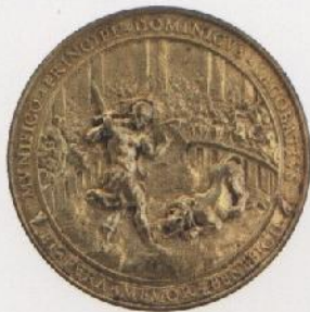
Homenaje a Alejandro VII, C. L. Bernini, 1659