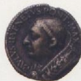
Fundación del palacio Veneto,