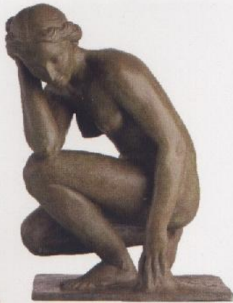
Venus del lago , R. Mateu, 1938

En la actualidad se están realizando gestiones para la firma del legado Mateu-Ruiz, por el cual el museo tendrá una importante representación de esculturas de Ramón Mateu.