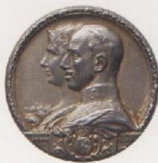
Exposición Internacional de Barcelona, A. Parera, 1929