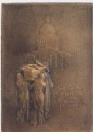
Funeral del presidente Sadi Carnot, O. Roty, 1894