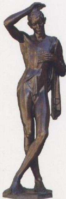
Fauno, J. B. Aduara, 1925