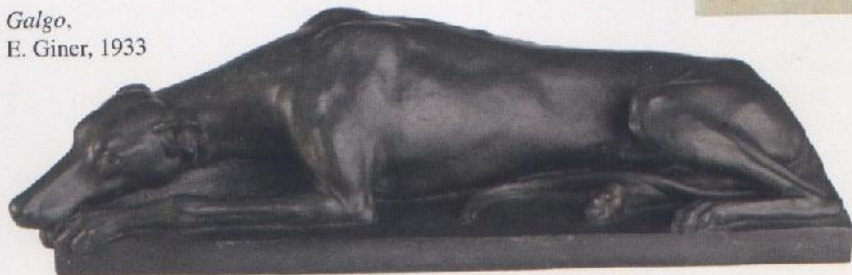
Galgo , E. Giner, 1933

Entre sus obras cabe remarcar las medallas conmemorativas de: I Centenario de Goya , IV Centenario de Luis de Vitoria , Juegos del Mediterráneo , Medalla para el Premio de las Exposiciones Nacionales de Bellas Artes , Real Academia de Farmacia de Madrid , Milenario de Castilla , Consejo Superior de Investigaciones Científicas , IV Centenario de Cervantes , Milenario del Tribunal de las Aguas , VII Centenario de la muerte de Jaime I .