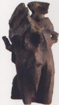
Grito , Perelló La Cruz, 1991