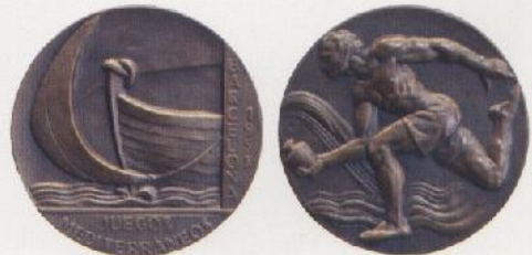
Juegos del Mediterráneo, E. Giner, 1955