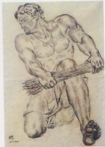
Rompiendo el haz , E. Giner, 1936