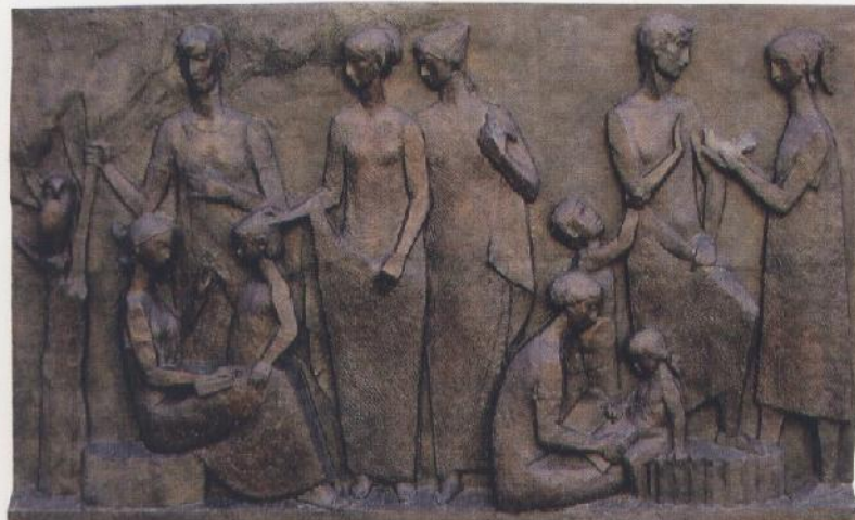
Les fruits de la mer, J. Estève Edo, 1986