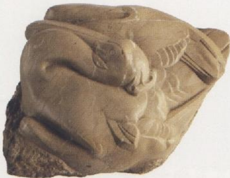
Pelicano, E. Giner, 1926